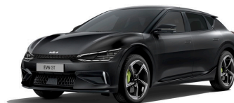
Aurora Black Pearl (ABP) metallic (pearleffekt)