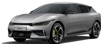
Mooncape (KLM) matt