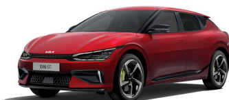
Runway Red (CR5) metallic