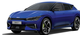
Yacht Blue (DU3) metallic