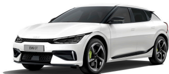
Snow White Pearl (SWP) metallic (pearleffekt)