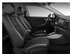
Svart interiör med svart delläderklädsel (konstläder) (GT Line)