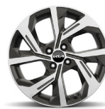
17 " aluminiumfälg (GT Line)