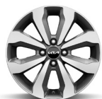
16 " aluminiumfälg (Advance)